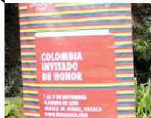
4 Escritores colombianos FIL OAXACA

Este encuentro literario se consolidó como uno de los más importantes del país, captando la atención de más de medio millón de personas. Ofreció más de 750 actividades, que incluyeron la presencia de escritores colombianos, entre los que destacaron Salcedo Ramos, Evelio Rosero y Nereo López.