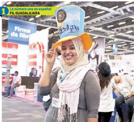
1 La número uno en español FIL GUADALAJARA

Escritores de Argentina y Colombia, el teatro de Japón y el narrador Salman Rushdie fueron algunos de los protagonistas