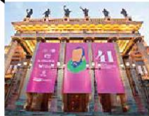
2 Japón y Nuevo León FESTIVAL CERVANTINO

Más de 500 mil personas invadieron la ciudad de Guanajuato para presenciar el Festival Internacional Cervantino, que tuvo como invitados a Japón y Nuevo León. Dejó una derrama económica de 450 millones de pesos, que se espera superar en la edición de 2015, cuando Chile, Colombia y Perú serán los invitados.