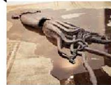
3 Reunión a 115 galerías ZONA MACO

En febrero se llevó a cabo la feria de arte contemporáneo Zona Maco, en la que participaron 115 galerías nacionales e internacionales y 40 proyectos individuales. Con 51 galerías, México fue el país que presentó más estudios participantes, sumando 51, después siguieron Estados Unidos con 23 y 18 de España.